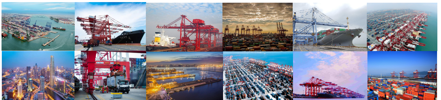
提质增效挖潜力 协同发展拓市场